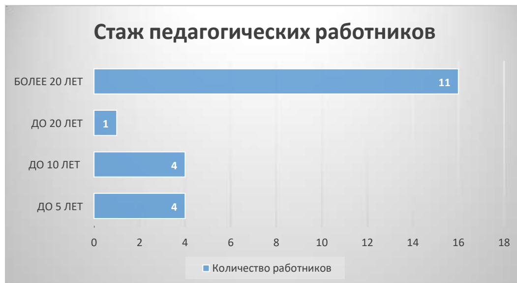
Диаграмма с характеристиками кадрового состава ДООУ.

По итогам 2022 года образовательное учреждение перешло на применение профессиональных стандартов. Из 20 педагогических работников МБДОУ №14 все соответствуют квалификационным требованиям профстандарта «Педагог». Их должностные инструкции соответствуют трудовым функциям, установленным профстандартом «Педагог».